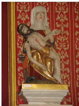
Pieta Gostomska z kościoła parafialnego w Nowym Mieście nad Pilicą