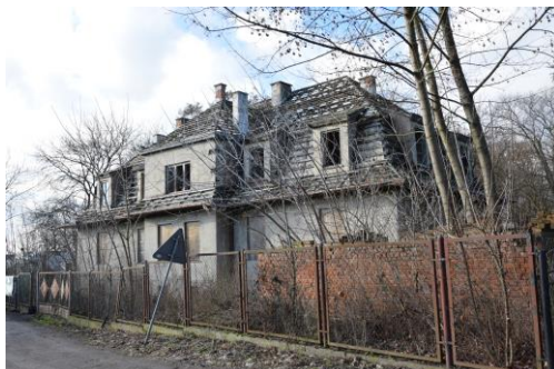
Budynek dworu w Żdżarach.