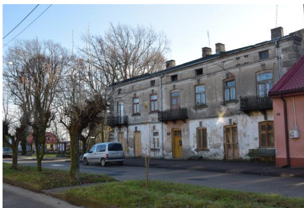
Kamienica przy ul. Targowej 48 w Nowym Mieście nad Pilicą

W bardzo złym stanie są: kamienica przy ul. Targowej 48 w Nowym Mieście nad Pilicą, kamienica na Pl. O. Koźmińskiego 10 w Nowym Mieście nad Pilicą. W mieście występują budynki przekształcone: dom przy ul. Pilicznej 9 i dom przy Warszawskiej 41. Pilnego remontu wymaga budynek dworu w Żdżarach, który nie posiada pokrycia dachowego.