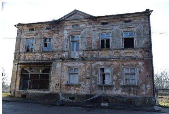
Kamienica na Pl. O. Koźmińskiego w Nowym Mieście nad Pilicą.