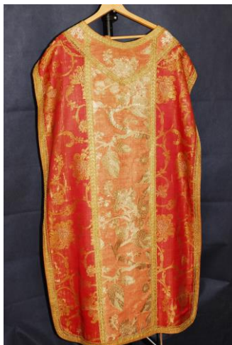
Ornat czerwony (XVIII w.) z kościoła parafialnego w Łęgonicach.

Wypożyczenie i wystrój zostało wpisane do rej. zabytków pod nr rej. 102/B/95 z dnia 16.01.1995 r. (16 poz.) . Wszystkie obiekty zabytkowe pochodzą z XIX w. Najcenniejsze są ołtarze boczne z 1850 r., ambona i chrzcielnica oraz polichromia ścienna.