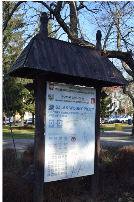
Tablica informacyjna w Nowym Mieście nad Pilicą