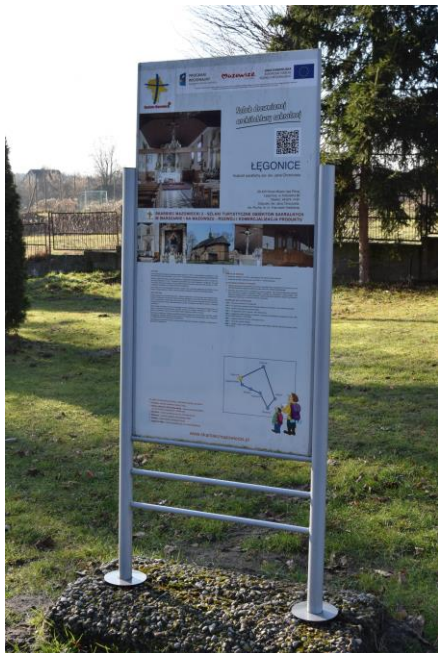
Tablica informacyjna przy kościele w Łęgonicach