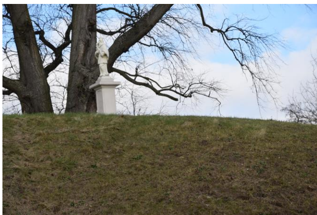
Figura św. Jana Nepomucena w Żdżarach

Najcenniejszymi obiektami są: figura św. Jana Nepomucena w Żdżarach (1795 r.), kapliczka św. Jana Nepomucena w Waliskach (XVII w.), figura NMP w Nowym Mieście nad Pilicą (1889 r.), kapliczka w Woli Pobiedzińskiej (1934 r.), kapliczka kubaturowa w Gostomii (XIX/XX w.)