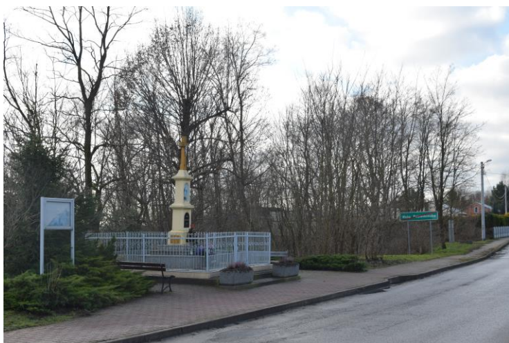
Kapliczka w Woli Pobiedzińskiej